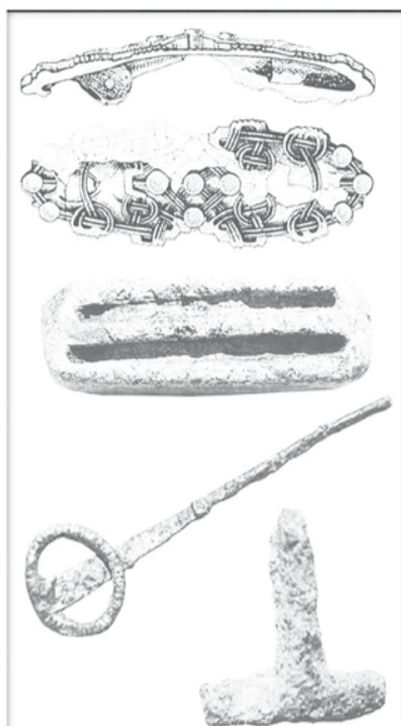
Находки из раскопок в Старой Ладоге: Скандинавская фибула, формочка для отливки платёжных слитков, булавка и подвеска «молоточек Тора»

Любши могли предложить своим гостям довольно широкий выбор изделий, прежде всего «литейно-ювелирного характера».