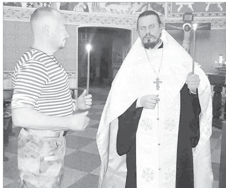
Принял крещение в Александро-Свирском монастыре