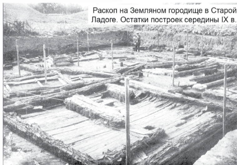
Раскоп на Земляном городище в Старой Ладоге. Остатки построек середины IX в.