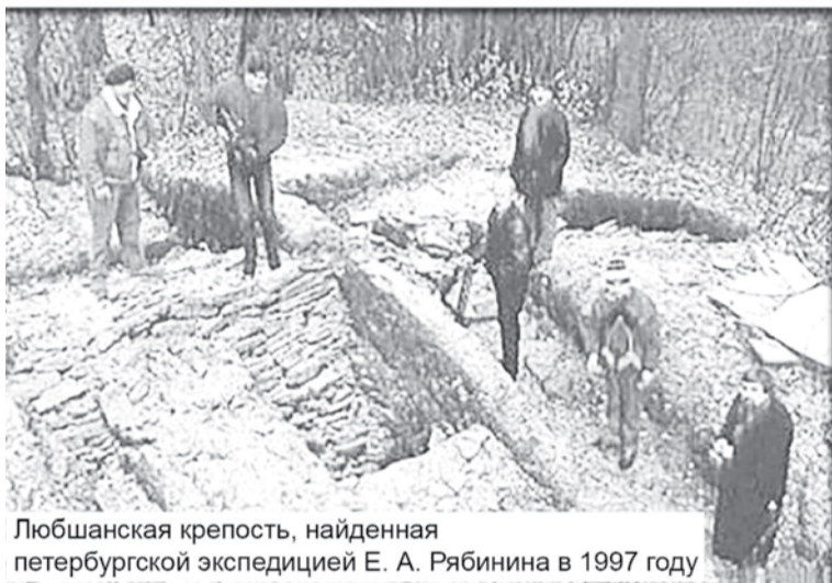
Любшанская крепость, найденная петербургской экспедицией Е. А. Рябина в 1997 году

новгородский купеческий караван из трёх морских лодий, возвращавшийся в Новгород. Однако на русских судах, высланных для встречи каравана, вовремя заметили врагов и вступили в бой.