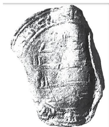
Арабский дирхем, найденный на раскопках