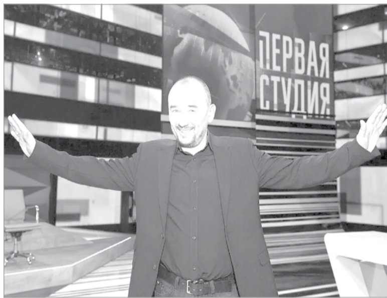
В студии программы «Время покажет»

« Я УВЕРЕН, ЧТО В СОВРЕМЕННОМ МИРЕ ЛЮБАЯ ВОЙНА ВЕДЁТСЯ, ВЫИГРЫВАЕТСЯ ИЛИ ПРОИГРЫВАЕТСЯ ОЧЕНЬ ЧАСТО В ПЕРВУЮ ОЧЕРЕДЬ НЕ ОГНЕСТРЕЛЬНЫМ ОРУЖИЕМ, КОТОРОЕ ЛЮДИ ДЕРЖАТ В РУКАХ. ПОЭТОМУ В ОБЩЕМ Я ПРОДОЛЖАЮ НАХОДИТЬСЯ В ГОРЯЧЕЙ ТОЧКЕ ИНФОРМАЦИОННОЙ ВОЙНЫ. »